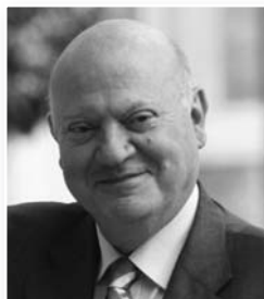
André Santini Député-Maire d'Issy-les-Moulineaux Président de la fédération d'Ile-de-France