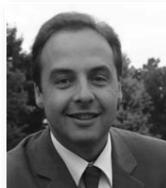
Jean-Christophe Lagarde Député-Maire de Drancy Président exécutif du Nouveau Centre

le dimanche 27 septembre 2009 à Rosny-sous-Bois de 10h à 16h